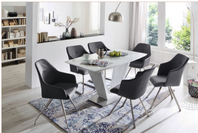
Stuhl & Schwinger MADITA mit Tisch ILKO

Schwingerstuhl Rundrohr Edelstahl gebürstet B/H/T ca. 54/88/62 cm Belastbarkeit: 130 kg VPE: 2