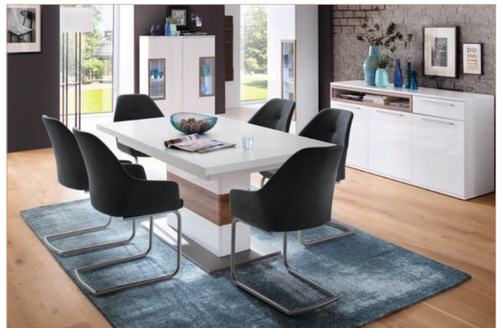
Schwinger MADITA mit Kastenmöbelprogramm PAMPLONA