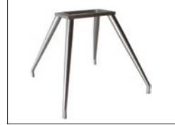
4 Fuß-Gestell oval, konisch