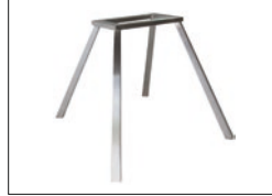
4 Fuß-Gestell eckig, konisch