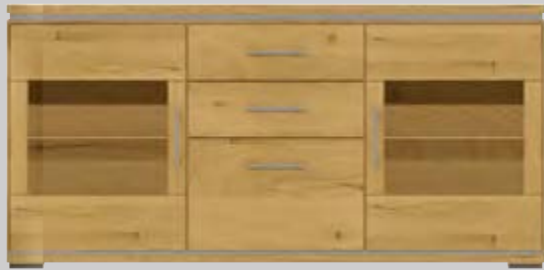
1014- Anrichte B 185 H 88 T 43 cm 3 Schubkästen, 2 Glastüren 499060 LED-Glasbodenbeleuchtung