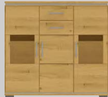
1044- Highboard B 140 H 126 T 43 cm 2 Schubkästen, 1 Holztür 2 Holz- / Glastüren 399071 LED-Innenbeleuchtung