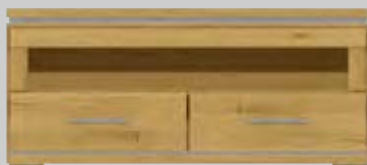
1024- Medienanrichte B 124 H 55 T 43 cm 2 Schubkästen, 1 offenes Fach lichtetes Maß des offenen Faches: B 110 H 18 T 41 cm