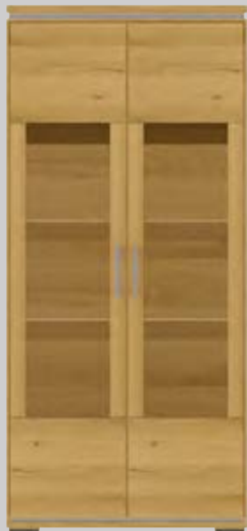
1074- Vitrine B 94 H 203 T 43 cm 2 Glastüren 499064 LED-Glasbodenbeleuchtung