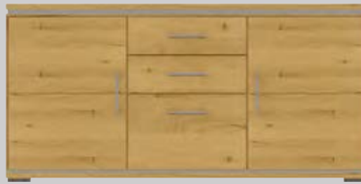
1004- Anrichte B 185 H 88 T 43 cm 3 Schubkästen, 2 Holztüren