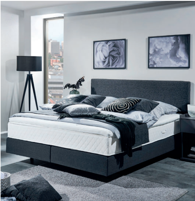
Kopfteil 1, glatt bezogen