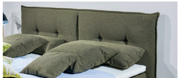
Kopfteil 3, Kissenoptik