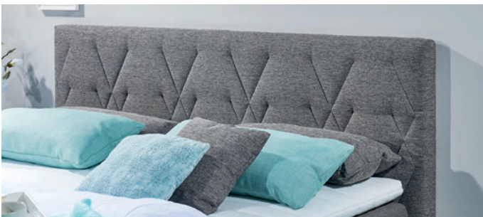
Kopfteil 2, Steppung Geometrie